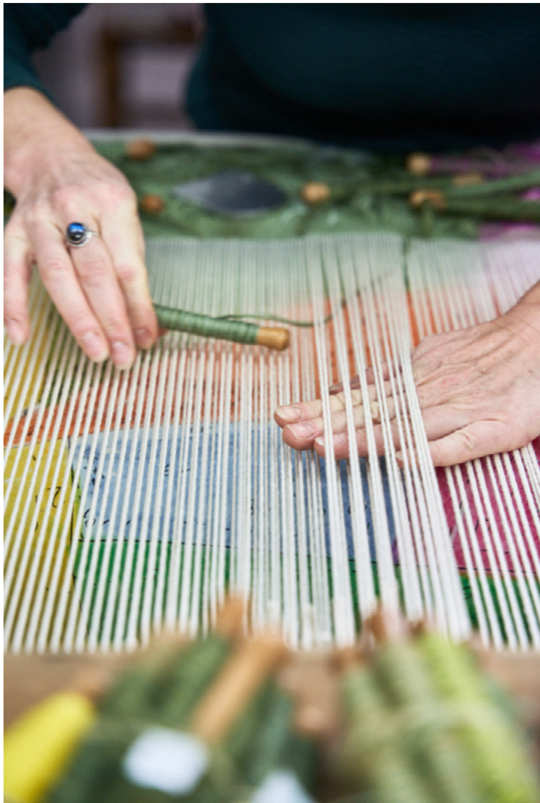
Tissage sur métier de basse lisse Weaving on a low warp loom