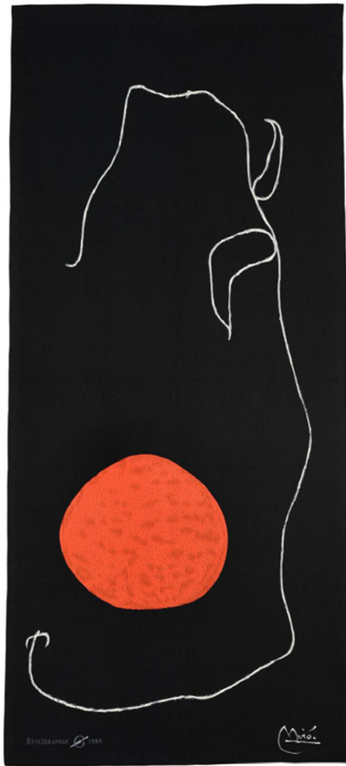
Tapiserie originale, Original tapestry Composition n°2 et Femme au miroir

Date de l'œuvre originale : 1966 Format de l'œuvre originale : 0,84 x 0,38 m Dates de tissage du premier exemplaire de la tapisserie : 2 fév. 1966 au 10 juin 1966 19 janv. 1966 au 10 juin 1966 Dimensions du premier exemplaire de la tapisserie : 3,73 x 1,69 m