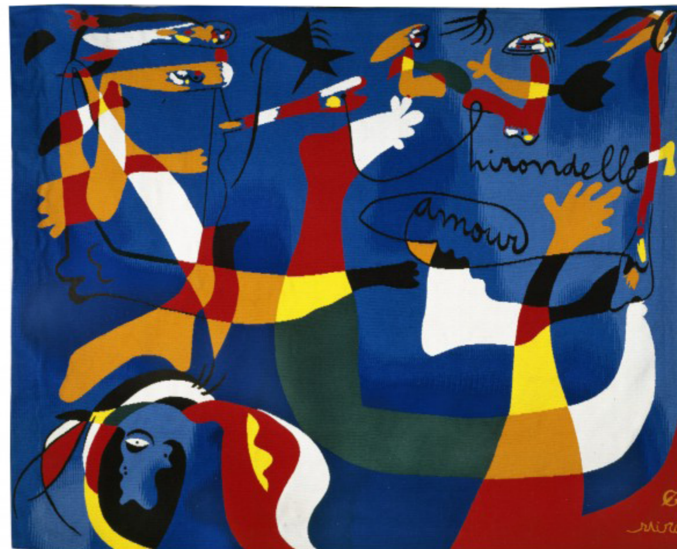
Tapisserie originale, Original tapestry Hirondelle d'amour

The Mobilier National now holds Miró's tapestries and rugs in its collections, and uses them to furnish prestigious venues such as the Elysée palace.