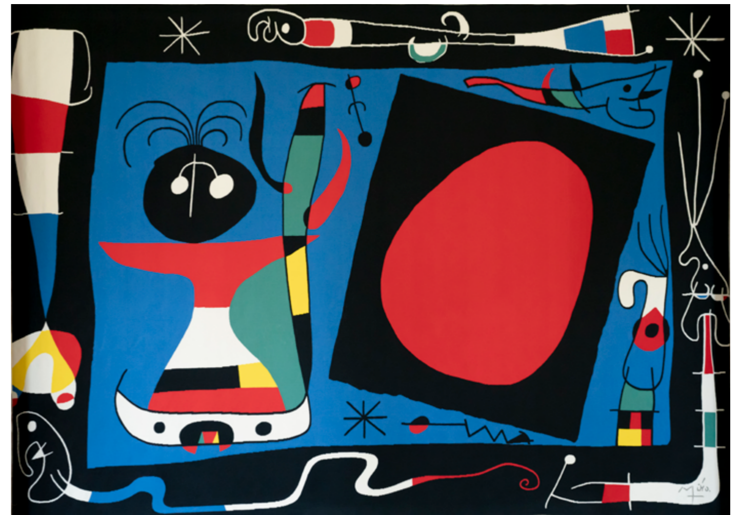
Tapiserie originale, Original tapestry Composition n°1 ou Femme au miroir

Date of creation of the original work : 1966 Size of the original work: 0,84 x 0,38 m Weaving dates of the first copy of the tapestry: 2 Feb. 1966 to 10 June 1966 19 Jan. 1966 to 10 June 1966 Dimensions of the first copy of the tapestry: 3 ,73 x 1,69 m