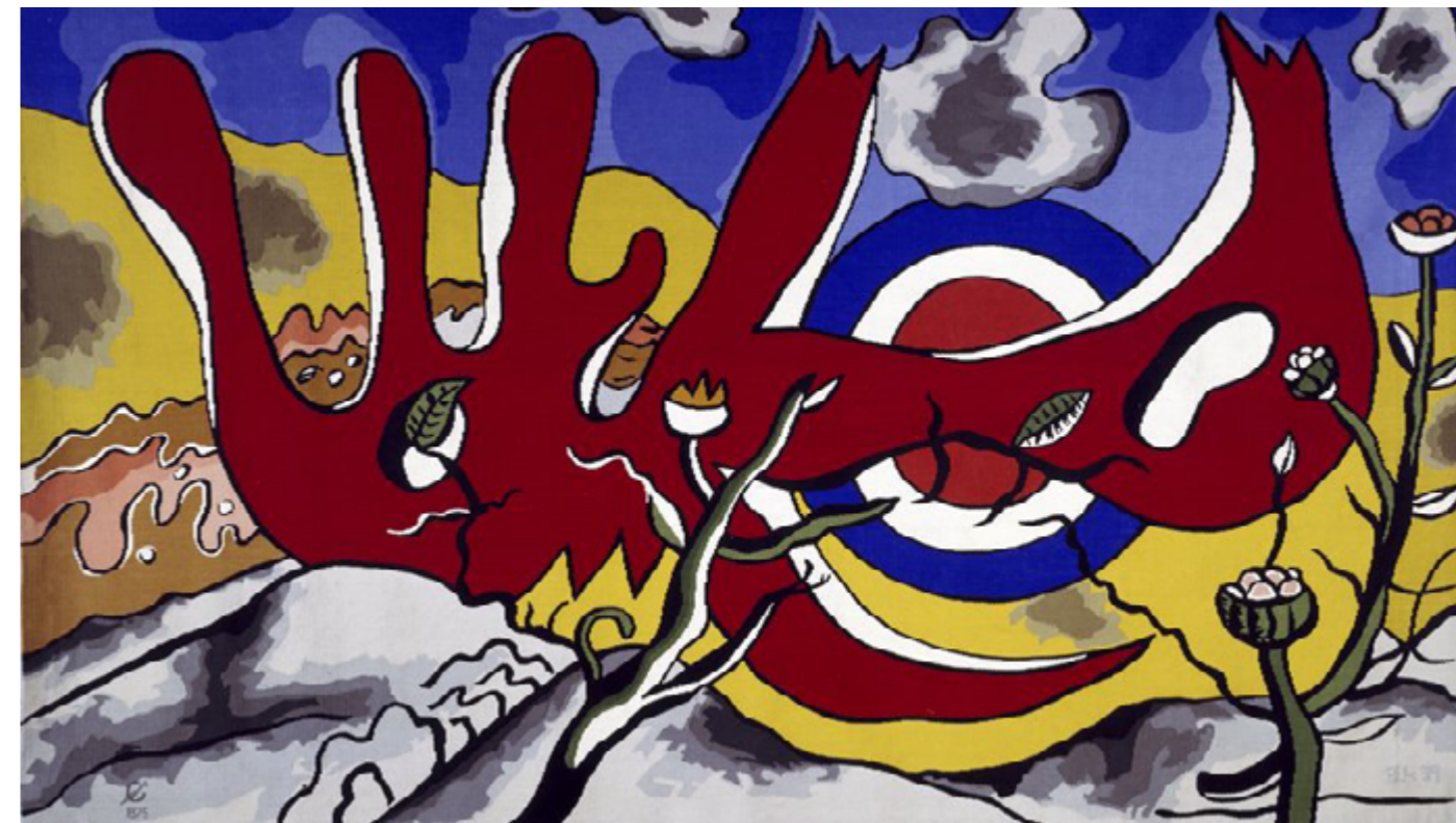
Tapisserie originale, Original tapestry ciel de france

In 1968, the Mobilier National bought the rights to two tapestries from Nadia Léger, the artist's widow, among several gouaches commissioned by the French Ministry of Education for a project for an aviation center in Briey in 1940. Only the work entitled Ciel de France was produced by the Manufacture Nationale des Gobelins. Ciel de France , woven in two copies in 1970 and 1975, is considered characteristic of Fernand Léger's plastic research into monumental painting in the late 1930s.